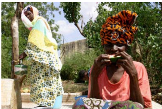
In der psychiatrischen Abteilung des öffentlichen Spitals point g in Bamako verteilt eine Solidaritätsstiftung hundert Mahlzeiten pro Woche