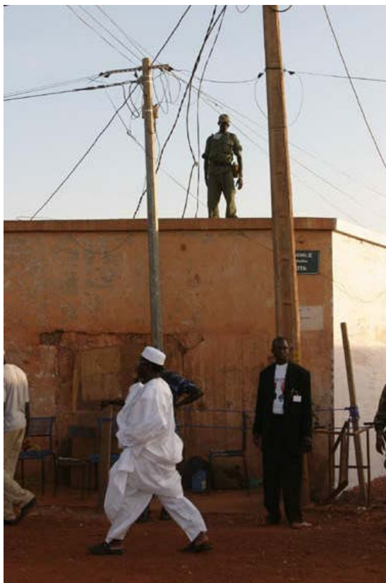
Joschka Fischer während seines dreitägigen Staatsbesuchs in Mali im Musée nationale in Bamako