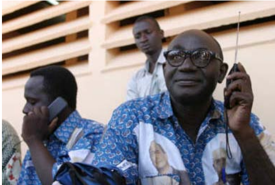
Pirogenfahrer auf dem Niger in Mopti jubeln Jaques Chirac zu.