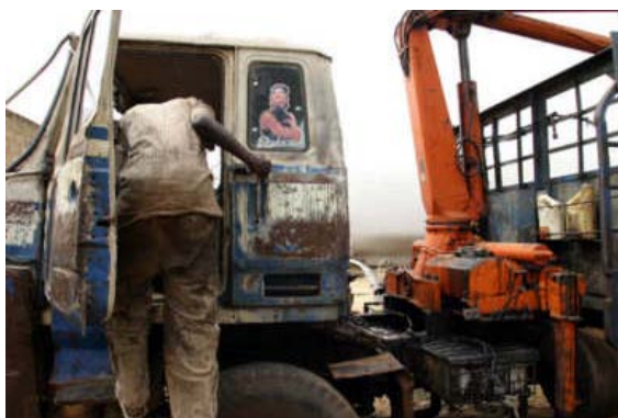
Autogarage in Segou