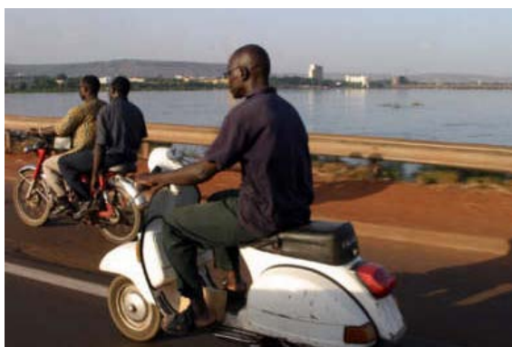
Feierabendverkehr auf dem Pont des Martyrs in Bamako