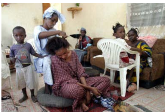
Das Ende des Ramadan naht- Frauen beim Frisieren