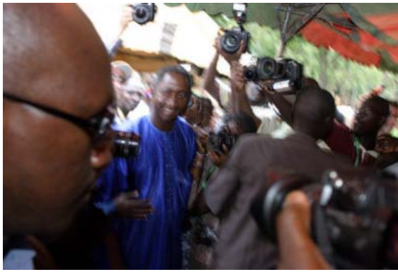
Am Flughafen von Mopti kurz vor der Ankunft des französischen Präsidenten Jaques Chirac