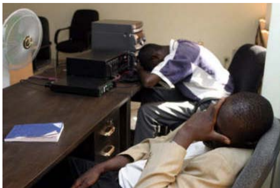
Zwei Journalisten warten auf den Beginn einer Pressekonferenz