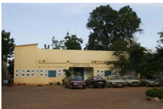
Die Section Photo der Agence maliennne de Presse- mein Arbeitsort