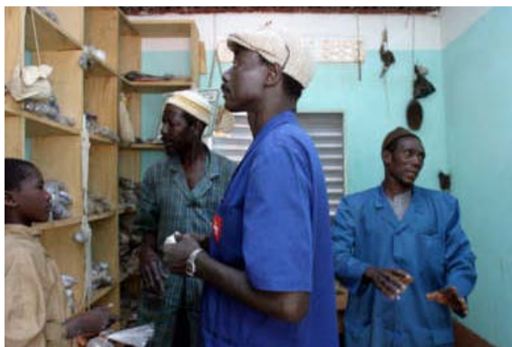
Verkaufsgeschäft eines Naturheilers